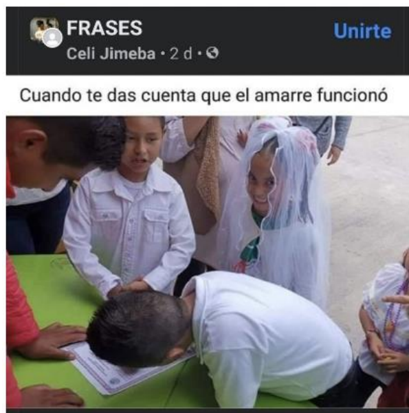
Imagen "fotografías" (documentales, periodísticas o caseras).

Nota. Meme No. 60 proporcionado por adolescentes de tercero de secundaria (2021).