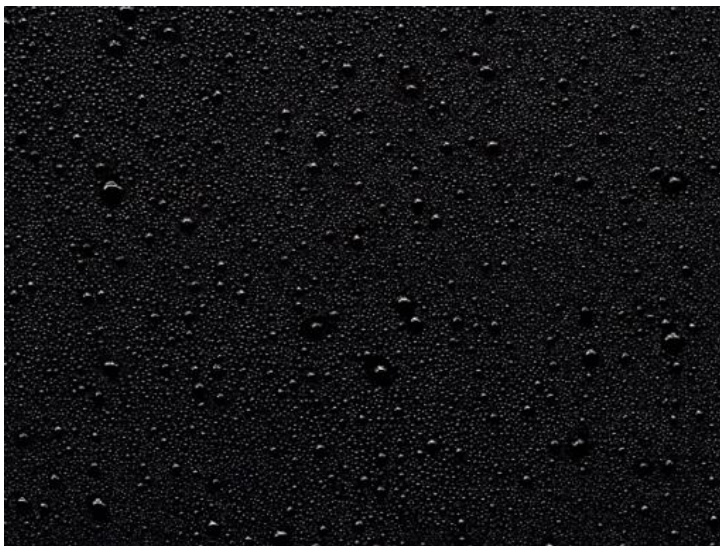
Imagen “Otro/No califica”

Nota. Meme No. 23 proporcionada por adolescente de tercero de secundaria (2021).