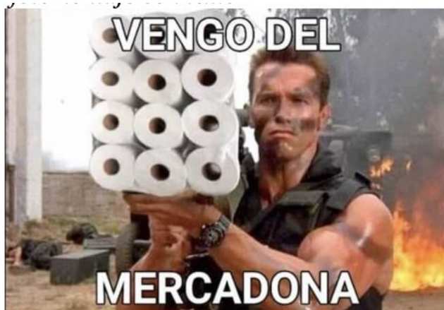
Imagen "Fotomontaje con texto"

Nota. Meme No. 72 proporcionado por adolescente de tercero de secundaria (2021).